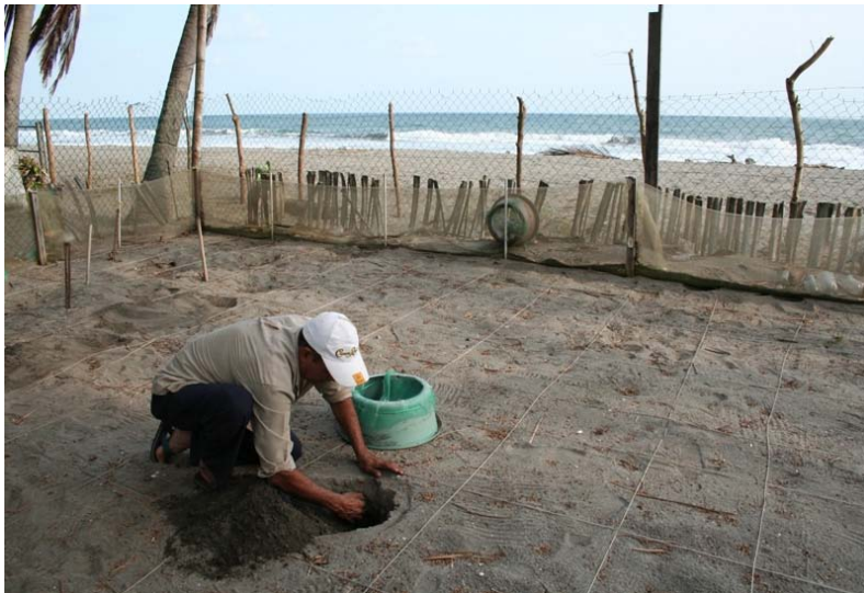
El estudio “Comercialización de huevos de tortuga marina en El Salvador” de USAID arrojó que solo un 2.7 % del total de huevos extraídos de las playas, se destina a la conservación.

Chelonia Mydas Agassizii (Tortuga negra o prieta) Puede medir hasta un metro. Es primordialmente hervívora.