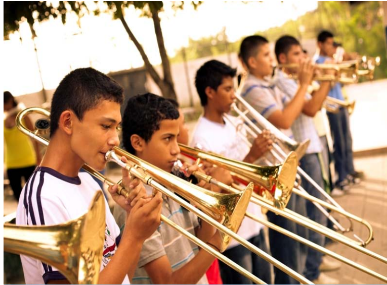
Beneficiarios del proyecto reciben clases de música como parte de los planes de prevención de la violencia.