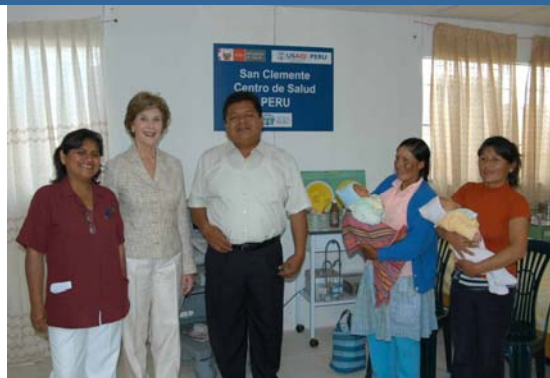
Primera dama, Laura Bush, junto a madres y bebés favorecidos por la donación de USAID/Perú y el personal técnico del Centro de Salud de San Clemente en Pisco.

La Sra. Laura Bush visitó dos proyectos en Ica el 21 de noviembre de 2008, antes de encontrarse con el Presidente George Bush para las actividades de APEC. Los proyectos son parte de la ayuda de reconstrucción que brinda USAID a los afectados por el terremoto de agosto de 2007. La Primera Dama visitó primero el Centro de Salud de San Clemente en Pisco, reconstruido con apoyo de USAID y tuvo oportunidad de conocer algunas de las actividades en salud comunitaria que complementan el proyecto, como lavado de manos, purificación de agua y monitoreo de crecimiento de niños. También entregó una máquina de ultrasonido para el cuidado pre-natal de las madres. En segundo lugar, ella entregó las llaves de su nueva casa a una familia damnificada. La casa fue construida con adobe mejorado y con una tecnología resistente a terremotos, en el marco de un proyecto de USAID mediante el cual se capacita a los beneficiarios para construir sus propias viviendas con estos materiales y esta tecnología. Los eventos en San Clemente con la señora Bush tuvieron amplia cobertura de medios.