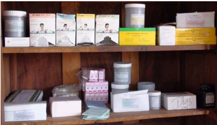
La disponibilité permanente des médicaments de survie (ACT) et autres produits contre le paludisme est une priorité du PMI.